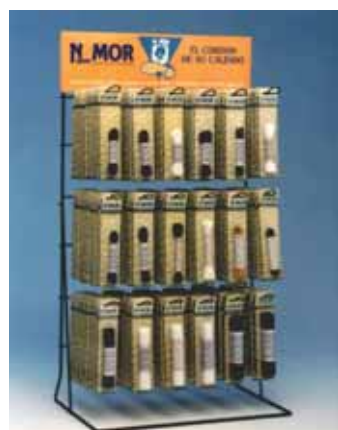
Expositor con capacidad de 180 pares según medida, de 8 a 12 blister por colgador ♦ Código 44701

Cordones para zapatos de larga duración presentados en blister de un par (excepto los de 50 cm.), fácil exposición y venta, mantiene su presentación al estar sellados en su envase, no cogen polvo ni suciedad.